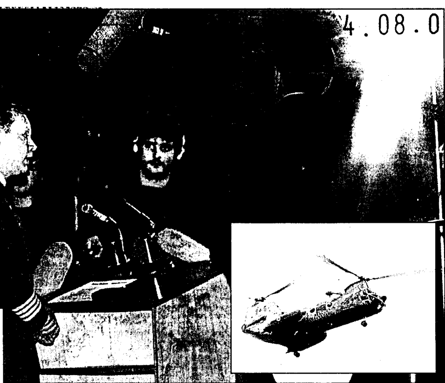
Le colonel Lloyd Campbell, au cours d'une conférence de presse convoquée hier par le ministre de la Défense nationale au sujet de l'accident impliquant un hélicoptère semblable à celui représenté ci-haut.

SAMEDI 22 JANVIER 1994 / LE JOURNAL DE MONTRÉAL 5